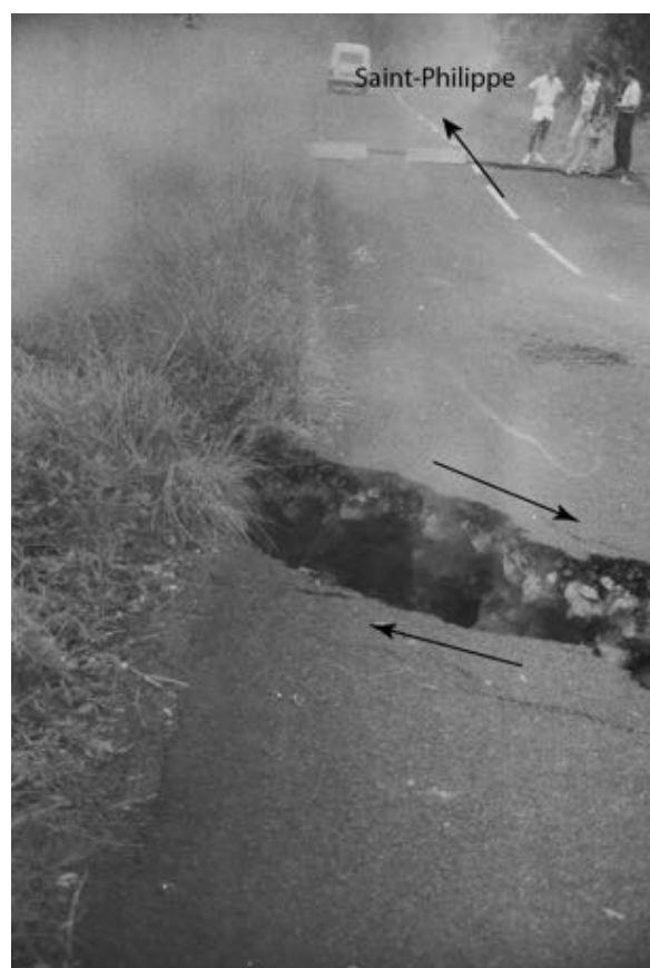
Figure 3: Fractures dans la RN 2 liées à la propagation du magma en sub-surface vers la Pointe de la Table. L'ouverture totale des fractures était de 105 cm et le décalage latéral, vers l'est, de la partie nord est de 41 cm (Delorme et al., 1989).

La disparition du trémor (signal sismique attestant de l'émission de lave) s'est poursuivie pendant 9h. Le 20 mars, à 00:20, une nouvelle fissure s'est ouverte hors de l'Enclos Fouqué, en amont du Piton Takamaka, vers 1000 m d'altitude. La lave émise au niveau de cette seconde fissure a alimenté deux coulées de lave qui se sont épanchées de part et d'autre du Piton Takamaka. Les bras de lave coupèrent la RN2 dans l'après-midi (le bras nord détruisant 8 habitations) et seul le bras nord atteignit la mer à 21h, le 20 mars (Delorme et al., 1989). L'activité éruptive se poursuivit à un niveau élevé les 21 et 22 mars avant une baisse dans la journée du 23. Ce même jour, des fractures émettant de la vapeur s'ouvrirent entre la RN 2 et la Pointe de la Table, indiquant la propagation du magma en sub-surface (Figure 3). La déformation de la route suggère que cet épisode s'est accompagné d'un glissement du flanc est du volcan, comme lors de l'éruption d'avril 2007 (Froger et al., 2015).