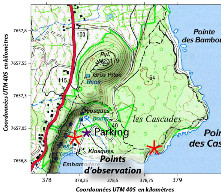
Figure 1: Localisation du point d'observation des cascades de l'Anse des cascades (fond topographique: carte IGN TOP25 série bleue). Les étoiles violette et rouge représentent respectivement le parking et les points d'observation.

Itinéraire: Depuis Piton Sainte-Rose, suivre la RN2 en direction du Sud (Saint-Philippe). Environ 2 km après l'église Notre-Dame des Laves, prendre à gauche en direction de l'Anse des Cascades. Suivre cette petite route sur 1,6 km et se garer sur le parking prévu sur la droite de la route. De ce parking, descendre vers la mer puis se rapprocher de l'ancienne falaise littorale d'où jaillit l'eau sous forme de cascades.