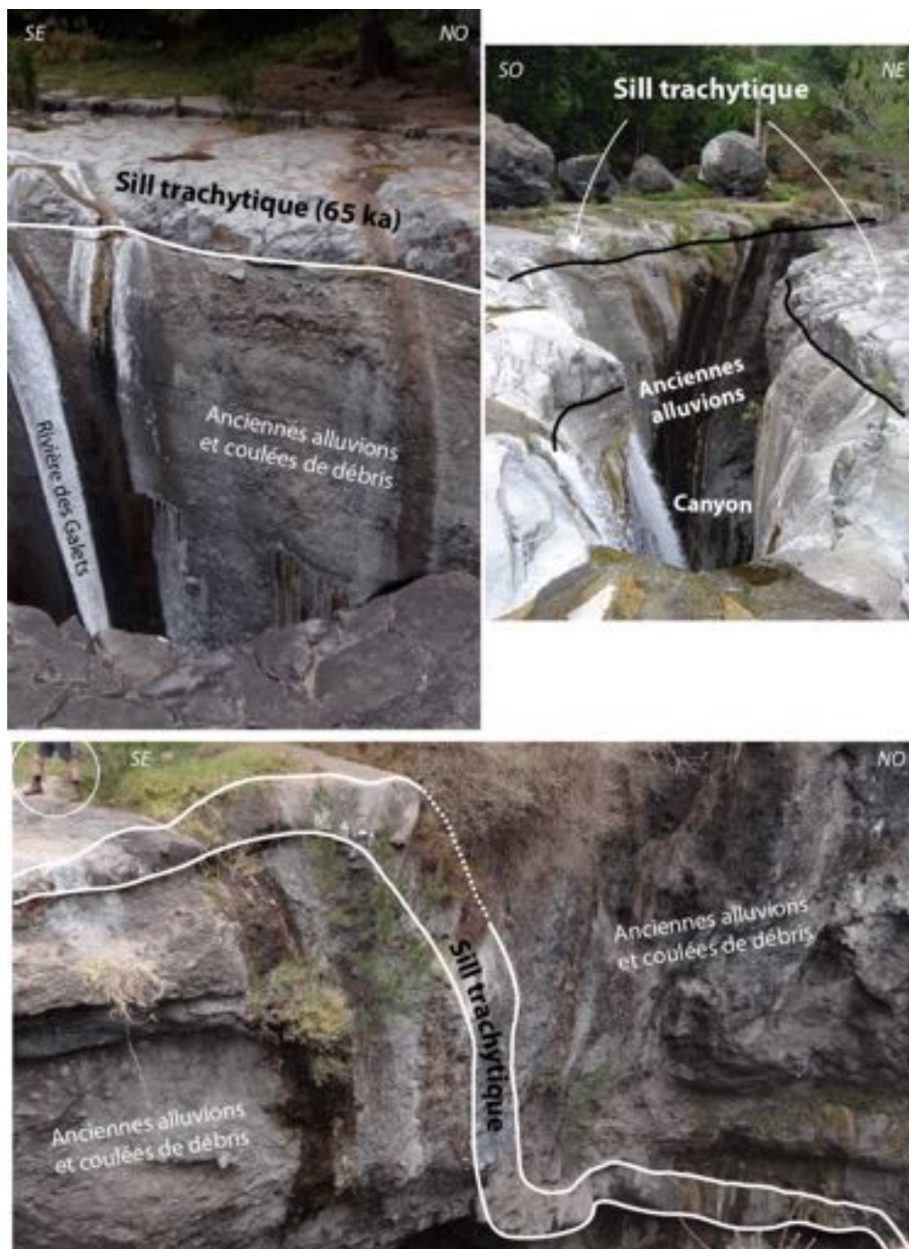
Figure 2: Sill trachytique des Trois Roches intrudé dans des brèches correspondant à d'anciennes alluvions et des coulées de débris. L'érosion de la Rivière des Galets entaille le sill et érode fortement la brèche sous-jacente.

que celle de l'intrusion. En aval de la cascade, le sill s'enfonce en paliers avec une alternance de portions verticales et horizontales (Figure 2).