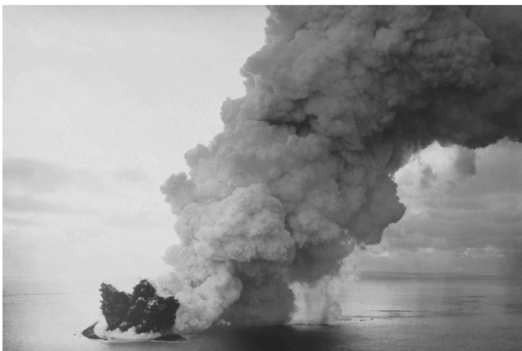
Figure 3: Eruption de Surtsey en 1963. Cette éruption, débutée à 130 m de profondeur, a entraîné la formation d'une île (Surtsey) correspondant au cône volcanique. L'interaction entre le magma et l'eau de mer provoquait la vaporisation de l'eau qui alimentait le panache blanc visible sur cette photo. Ce panache était également constitué de cendres volcaniques que l'on voit retomber sous le panache.

Le dynamisme éruptif est appelé dynamisme surtseyen en référence à l'île islandaise de Surtsey qui s'est formée lors de l'éruption de 1963-1964 (Figure 3).