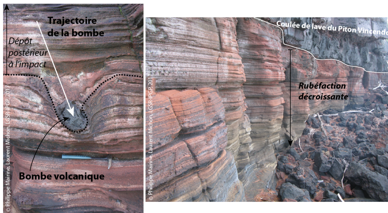
Figure 6: Dépôt hyaloclastique finement stratifié avec une figure d'impact ( bomb sag ) liée à la chute d'une bombe volcanique pendant l'éruption (gauche). La couleur rouge du dépôt résulte d'une oxydation du fer liée au réchauffement du dépôt par la coulée de lave issue du Piton Vincenzo. Ce processus est appelé rubéfaction (droite).

Les hyaloclastites finement stratifiées présentent localement des figures d'impact ( bomb sag en anglais) causées par la chute de bombes volcaniques (taille >64 mm) après une trajectoire balistique dans l'atmosphère (Figure 6). L'enfoncement des bombes indique que le dépôt était meuble au moment de l'impact. Le caractère asymétrique de l'enfoncement informe également sur la trajectoire de la bombe et implicitement sur la direction de l'événement (Figure 6).