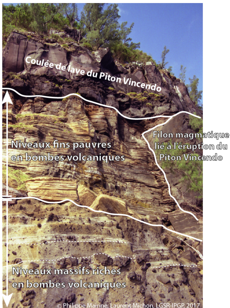
Figure 5: Stratigraphie de la falaise littorale située à environ 200 m à l'Ouest du Cap Jaune. Les niveaux inférieurs plus épais résultent d'une interaction eau - magma avec l'eau en excès. Les niveaux fins (cm) témoignent d'un changement de dynamique lié à une baisse de la proportion d'eau. Ceci favorise l'explosivité et la fragmentation du magma en élément micro à millimétriques. Les hyaloclastites sont recouvertes par la coulée de lave du Piton Vincenzo et intrudées par un filon magmatique lié à cette phase aérienne.

Les hyaloclastites finement stratifiées présentent localement des figures d'impact ( bomb sag en anglais) causées par la chute de bombes volcaniques (taille >64 mm) après une trajectoire balistique dans l'atmosphère (Figure 6). L'enfoncement des bombes indique que le dépôt était meuble au moment de l'impact. Le caractère asymétrique de l'enfoncement informe également sur la trajectoire de la bombe et implicitement sur la direction de l'événement (Figure 6).