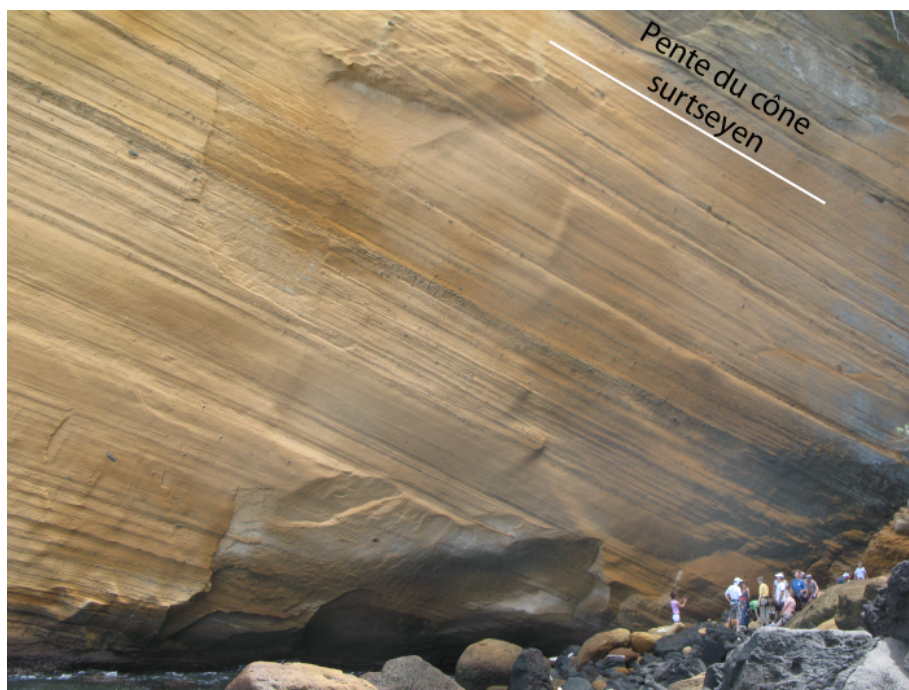
Figure 4: Haut: Falaise du Cap Jaune constituée de hyaloclastites issues d'une éruption surtseyenne. La couleur jaune de la falaise provient de la palagonitisation des hyaloclastites. Bas: Détail du dépôt montrant le nombre considérable de niveaux; chacun étant lié à une explosion. La proportion variable en éléments basaltiques d'un niveau à l'autre résulte d'une différence d'intensité pour chaque explosion.